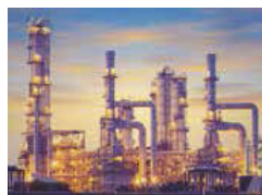
Oil and gas