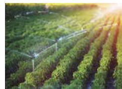
Agriculture and irrigation